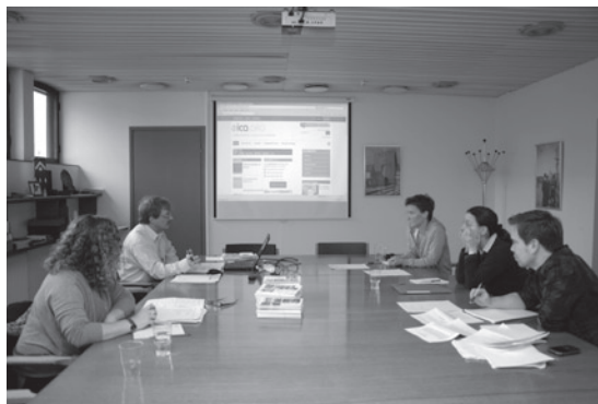
Reunió de la Secció Internacional d'Arxius d'Esports al CIA-ICA.