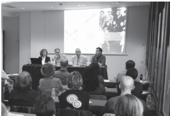
Acte de presentació de l'estudi sobre el patrimoni fotogràfic del món local gironí.