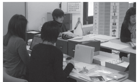
Sala de consulta de l'Arxiu Municipal de Tarragona