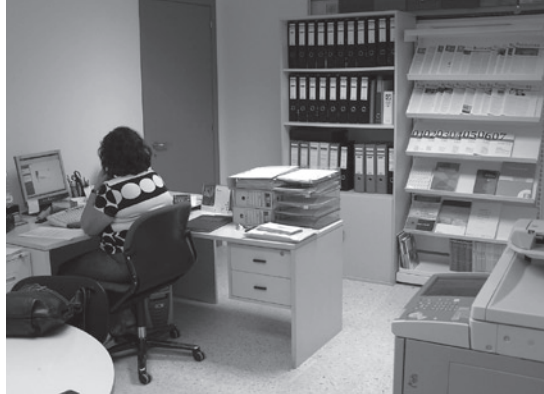
Nova seu de l'AAC

Per tant, a partir d'ara l'AAC atindrà els seus so-