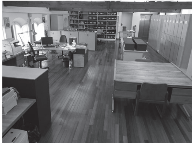
Sala Treball i consulta de l'Arxiu del Monestir de Bellpuig de les Avellanes