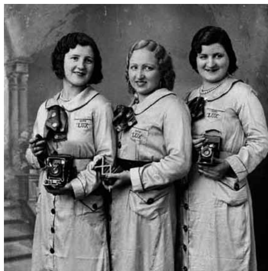
Ajuntament de Girona. CRDI (Foto Lux. 1929)

El programa, que compta amb la col·laboració de professionals de reconegut prestigi, s'estructura en sis mòduls i abasta tots els aspectes que intervenen en la gestió dels fons d'imatges. Així mateix, el programa ve a suplir la manca d'una oferta docent especialitzada que proporcioni una formació orientada, tant al coneixement de la producció fotogràfica, com al seu tractament, conservació i difusió.