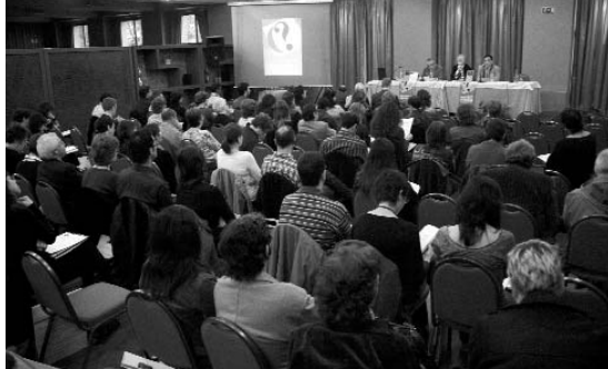
Acte inaugural de les Jornades d'Imatge i Recerca. Girona, novembre de 2006

Una vegada més, i de manera biennal des de 1990, les Jornades Varés han convocat a la ciutat de Girona un elevat nombre d'especialistes per debatre els diferents aspectes vinculats al tractament de la imatge. Enguany, més de 210 inscrits procedents de catorze països diferents han participat en la proposta de Taller (Fons fotogràfics: estratègies i tècniques per a un ingrés adequat) i en les Jornades estrictament dites, que començaren el dia 16 de novembre amb l'aportació de Werner Matt, que analitzava el sistema d'arxius fotogràfics i audiovisuals a Àustria i la seva legislació genèrica. Aquesta ha estat una constant en el programa de les Jornades: convidar persones de diferents països europeus (França, Alemanya, Països Escandinaus, Suïssa, Regne Unit, etc.) permet conèixer diferents sistemes d'organització i ofereix la possibilitat tant de compartir experiències com d'adoptar i adaptar models que ens poden ser d'utilitat.