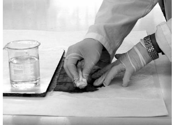
Hidratació amb hisop de cotó impregnat amb aigua i alcohol al 50%

aquest procés per la cara de la carn i que, com amb tot tractament humit, cal prèviament fer l'anàlisi de solubilitat dels elements sustentats en els dissolvents usats. Per tal de relaxar els pergamins d'una manera lenta i homogènia, podem disposar d'una cambra d'humectació, que ens permet controlar la humitat relativa i temperatura de l'interior de l'espai, i permet treballar amb més quantitat de peces alhora. En cas de no disposar d'una cambra d'humectació, podem condicionar un espai el més estanc possible on introduir humitat mitjançant un humidificador per ultrasons, vigilant sempre les possibles condensacions.