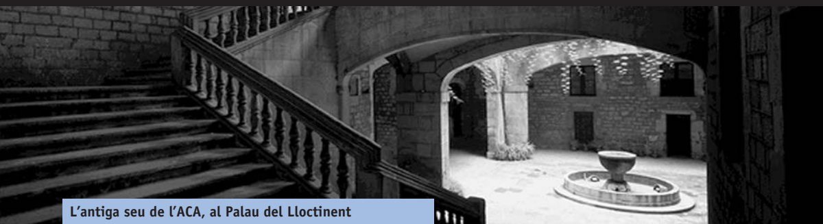
L'antiga seu de l'ACA, al Palau del Lloctinent