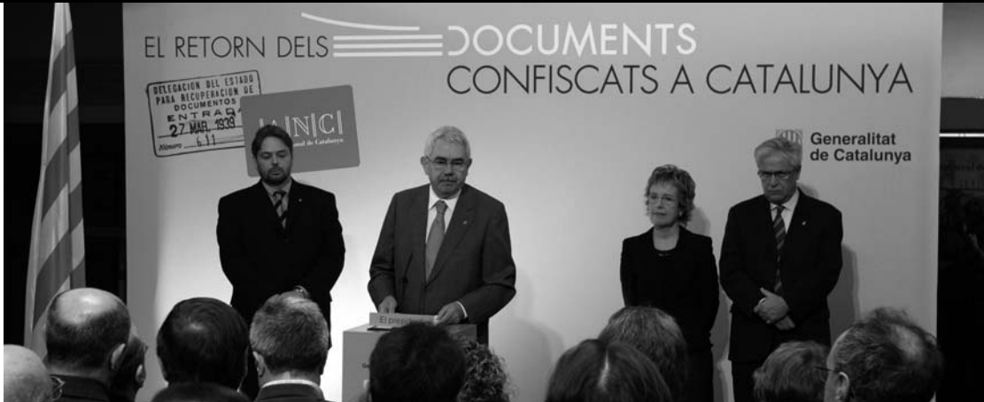
Inauguració de l'exposició "El retorn dels documents confiscats a Catalunya" al Palau Moja de Barcelona.