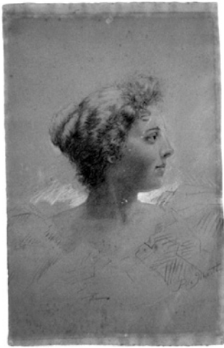
Reserves de llum en els marges per superposició del passepartout

Un exemple clar d'aquestes reaccions fotoquímiques és el fet que el sol va ser el primer blanquejant que van utilitzar els mestres paperers per a fer més blanc l'antic paper de draps. En canvi, en el paper de pasta de fusta (utilitzat actualment) causa l'efecte contrari, enfosqueix la cel·lulosa.