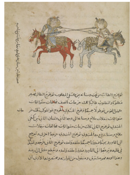
Aqṣarāʾī, Muḥammad ibn ʿĪsā ibn Ismāʿīl al-Ḥanafī [97r] (205/602), British Library: Oriental Manuscripts, Add MS 18866, in Qatar Digital Library

Els bibliotecaris han d'anar a buscar la documentació al dipòsit i dipositar-la al magatzem propi del projecte. La Biblioteca Britànica té uns protocols a l'hora