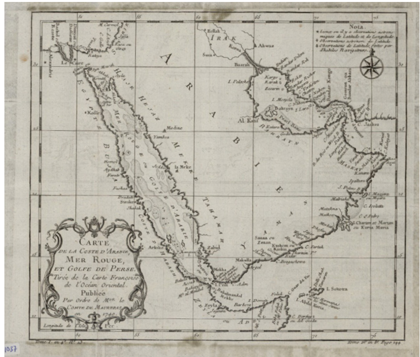
Map of the Coast of Arabia, the Red Sea and the Persian Gulf, Qatar National Library, 2918, in Qatar Digital Library

La qüestió principal a l'hora d'implementar un projecte de digitalització amb accés en línia a la informació és tenir en compte els documents amb copyright o afectats per la llei de protecció de dades sensibles. En aquest projecte es treballa amb fonts documentals que poden estar afectades per ambdues coses. En primer lloc, a l'hora de fer la descripció documental, els arxivers han d'entrar al sistema (SharePoint), un per un, els diferents tipus de copyrights de cada document. Amb els copyrights més habituals no hi ha cap mena de problema perquè