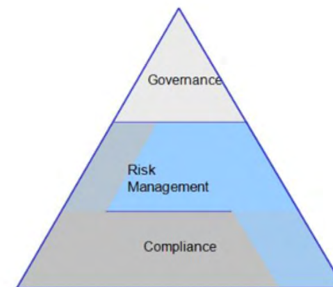
Fig. 1 GRC combine the disciplines of corporate governance, IT governance, information governance, risk management, security, data protection and compliance as an end-to-end process model. 15 La GRC combina les disciplines de la governança corporativa, la governança de les TI, la governança de la informació, la gestió del risc, la protecció de dades i el compliment normatiu com un model de procés integral.

gestió del risc. Durant molt temps, però, aquestes tasques complexes es van considerar àrees de treball individuals que es distribuïen entre departaments i càrrecs diferents i s'aplicaven a solucions específiques. Des d'aquesta perspectiva, es fa evident que cal una visió global de la companyia. Considerar per separat la governança, la governança de les TI, el compliment normatiu i el compliment normatiu de la gestió de la informació, la gestió del risc i la gestió de la qualitat no es tradueix en la transparència, la traçabilitat i la coherència necessàries. Per a l'aplicació en els processos i l'organització d'una companyia o administració, fa falta una visió global en què la governança proporcioni les normes i directrius, la gestió del risc les avalui i el compliment normatiu en garanteixi l'aplicació pràctica i operativa.